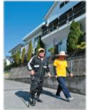
天気の良い日は堀川運河沿いをみんなでのんびりお散歩します