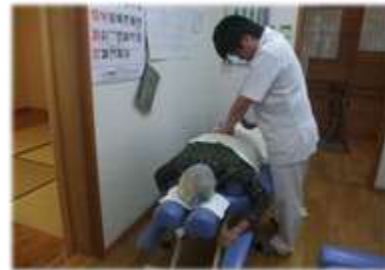
機能訓練として、午前・午後の2回、手技(マッサージ)により筋肉をほぐし、循環を良くする事で身体の動きを良くします

また、希望される方には、鍼・お灸のサービスも提供しています。自分ではなかなか体を動かす事が困難な場合でも、徒手療法(マッサージ)で硬くなっている身体をほぐすことができ、みなさんから大変喜ばれています。