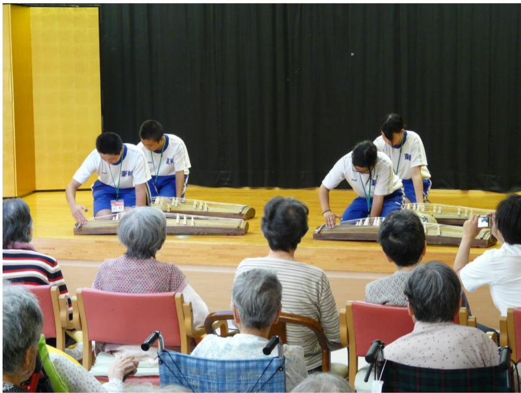
東郷中学校の生徒さん4名来園

7月11日から7月12日まで福祉体験学習の機会を得ました。利用者の方々との交流、生徒さん自身で企画したゲーム及び琴演奏を披露。